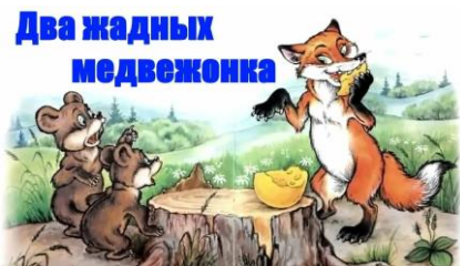
Два жадных медвежонка